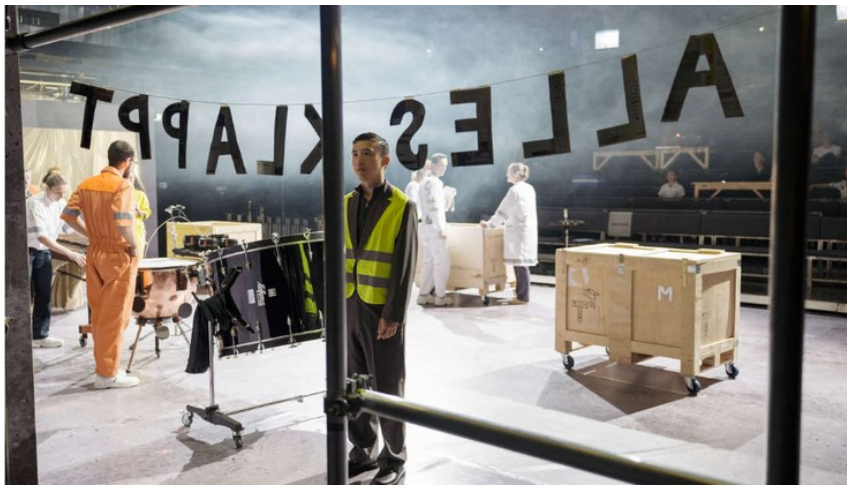
«Alles klappt» wird ab 19. Oktober im Gare du Nord zu sehen sein.